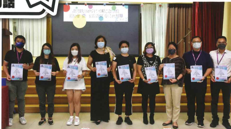
新一屆家長教師委員會合照