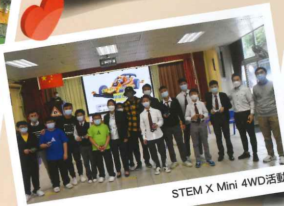
STEM X Mini 4WD活動