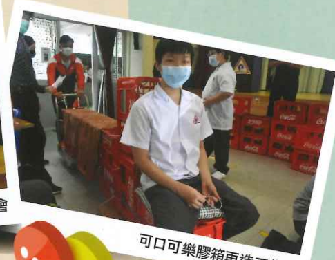
可口可樂膠箱再造工作坊