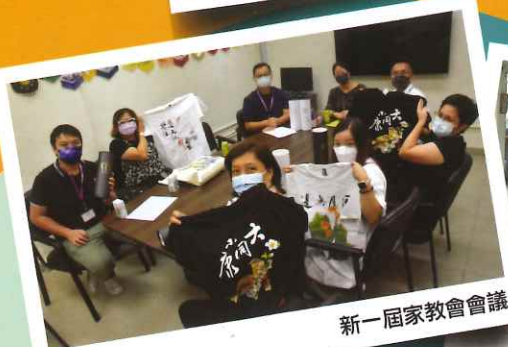
新一屆家教會會議