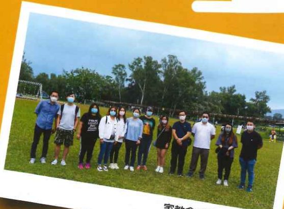
家教會成員與家長合照