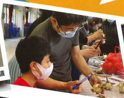
家長種植水仙活動