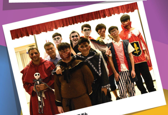
萬聖節英文科活動