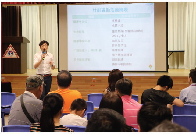
健康校園計劃嘉賓講者介紹服務