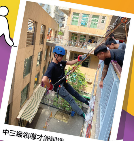
中三級領導才能訓練