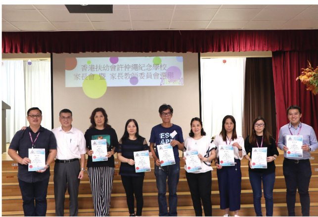
新一屆家教會委員合照