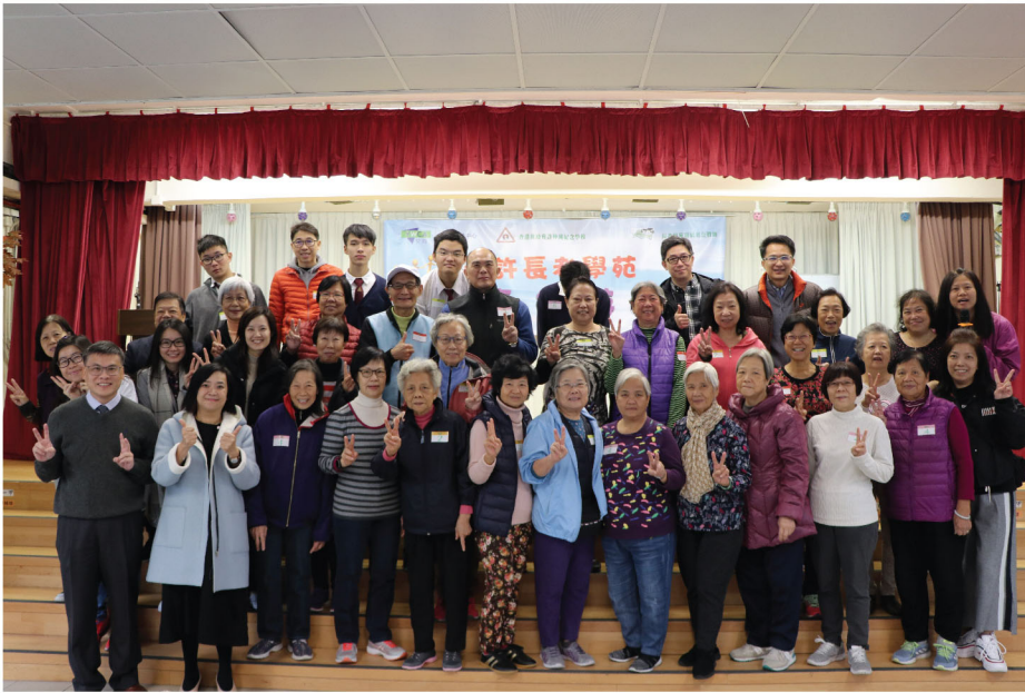
青許長者學苑長幼共融活動