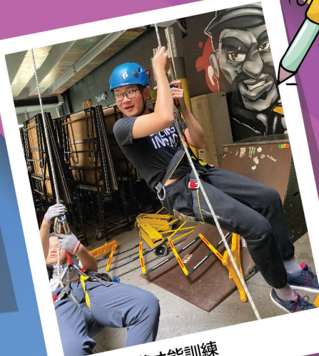
中三級領導才能訓練