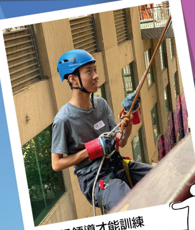
中三級領導才能訓練