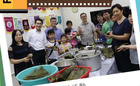
家長小組親子包粽活動