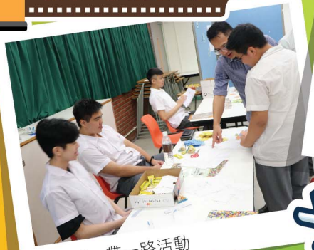
數學科一帶一路活動