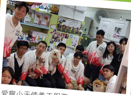
愛寵小天使義工服務