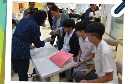
全港中學生時裝設計比賽