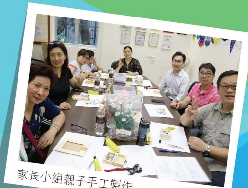
家長小組親子手工製作