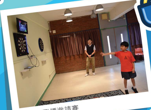
群育盃飛鏢邀請賽