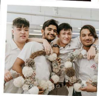
南豐紗廠 環保聖誕飾物製作