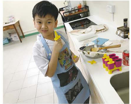
夏天就是要吃雪條呀！自己製作也很方便。