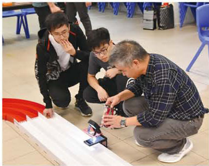
為使比賽更公平和公正，賽前的檢查可謂一絲不苟。