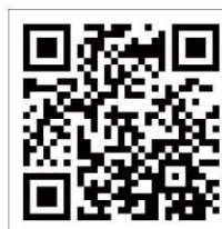
資助海外升學津貼計劃 - 學生特輯分享 (顏樹森上)