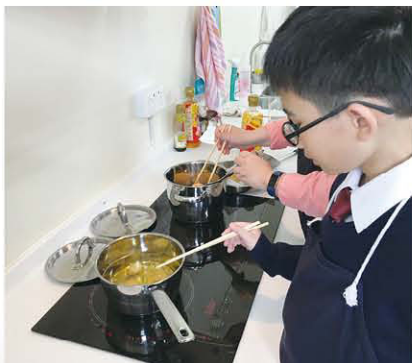
製作賀年食品煎堆，完成後可以把製成品帶回家送給家人呢！