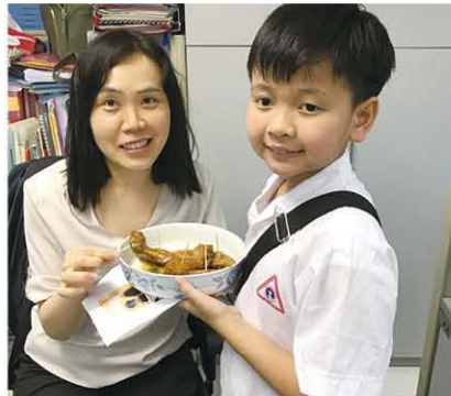
分享食物是烹飪的樂趣之一呀！