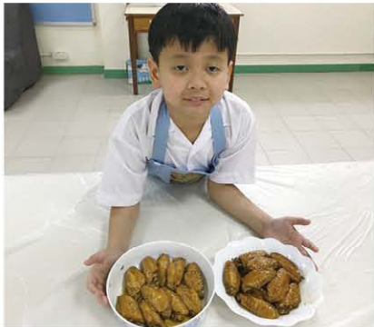
可樂雞翼製作很簡單，卻十分美味呢！