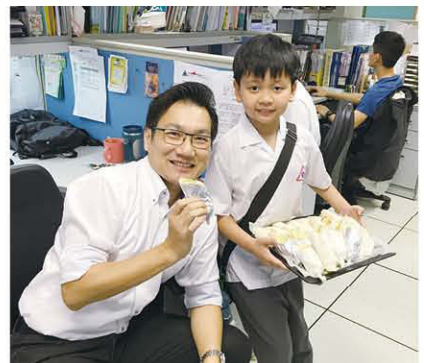
請老師吃我製作的墨西哥卷，大獲好評。計