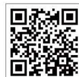
香港扶幼會聯校 STEAM x Mini 4WD 學習日影片