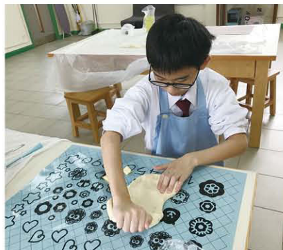
搓麵粉講求耐力及體力，不能操之過急。