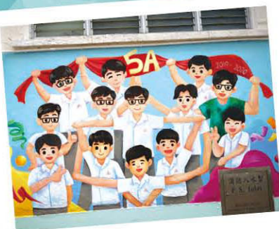
許校美化校舍壁畫設計