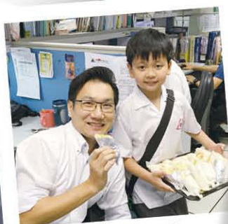
小學生校園生活 花絮