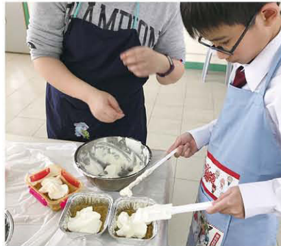
在老師的指導下，我已學會製作芝士蛋糕。