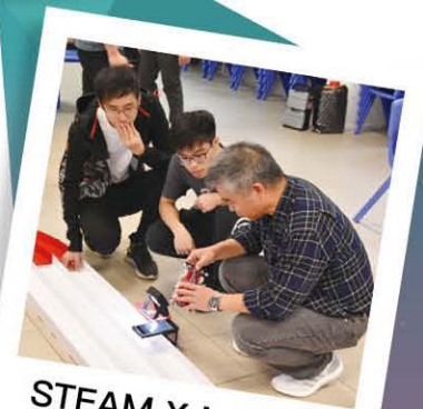
STEAM X Mini 4WD 學習日