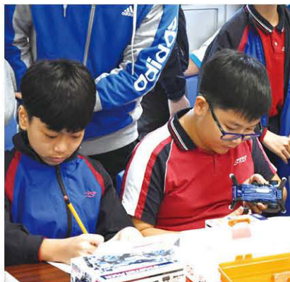
參賽者認真地運用公式計算四驅車的效能