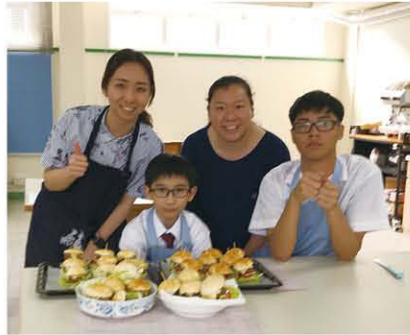
在老師的指導下，我也能造漢堡包。