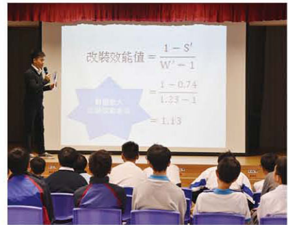
許校羅 SIR 正教授同學如何透過數學公式的計算，以提升四驅車的效能。