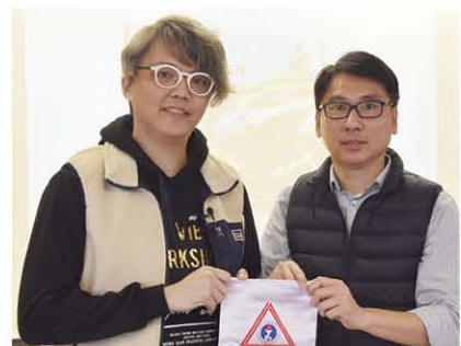
感謝香港迷你四驅協會盧先生擔任是次比賽的嘉賓，並為賽事提供專業意見。