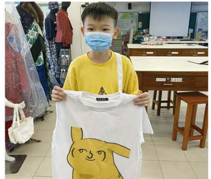
在學校的製衣工場，我也能設計出我喜愛的服飾。