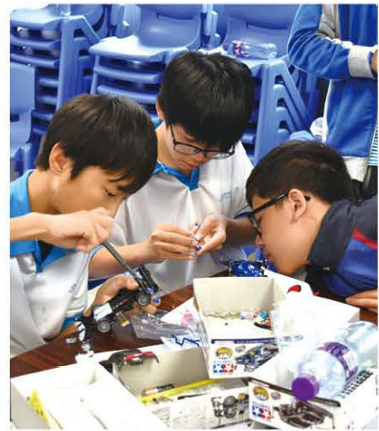
妥善的裝嵌亦是致勝關鍵之一