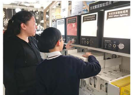
老師帶領學生逛 IKEA 傢俬中心，從而學會一些生活技巧、家居設計及家電節能等知識。