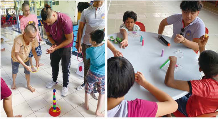
扶少團團員為院友準備的遊戲，小朋友都能樂在其中。