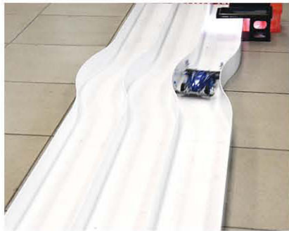
利用專業的儀器計算四驅車的圈數和時間，以得出數據來判斷比賽名次。