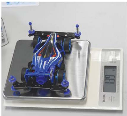
四驅車的裝備固然重要，但過多亦會令速度減慢，所以計算是十分重要。