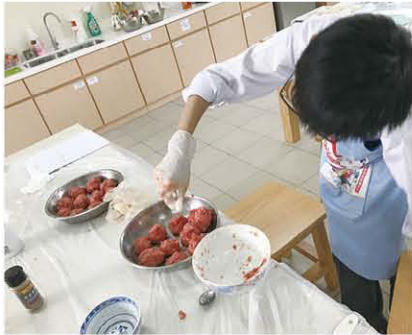
製作免治牛肉，過程不能馬虎呢！

許校自 2018- 2019 年度開辦小五、小六課程以來，均致力推行多元化的課堂，希望學生可以透過體驗不同的活動，發掘並投入自己的興趣，從而陶冶性情，令自己的行為情緒有所改善，並體現本校校訓「自尊、自治、自立」的精神。去年的生活技巧課就為學生帶來各式各樣的課堂活動，同學們都能樂在其中呢！