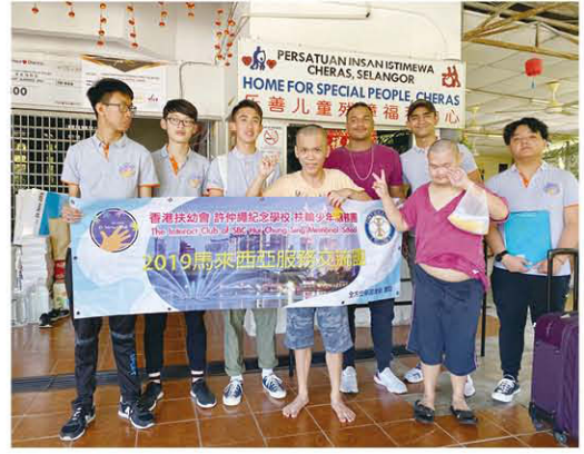
是次服務活動順利完成，多得幹事們與當地職員緊密的事前溝通。