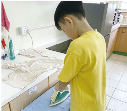
自己的圍裙自己製作，凡事親力親為。