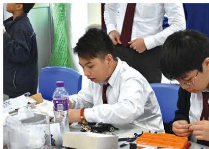
許校同學積極參與賽事，樂在其中。