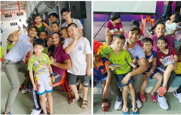
短短數小時的相聚，小朋友與我們的團員已打成一片。