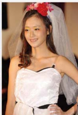
一襲婚紗和甜蜜的笑容，傳遞著解毒後步向幸福的信息。