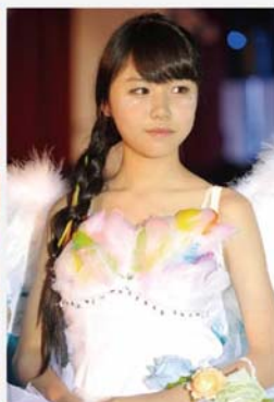
仿如天使般的衣裳，象徵帶領青少年遠離毒品，步向康莊。