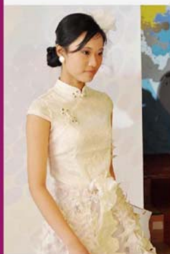
以旗袍為設計藍本的作品，散發著東方古典魅力。

本校舉辦這個比賽正值香港毒品問題最為險峻的時期，青少年濫用藥物最泛濫之際，所以本校希望能藉此喚起在學的青少年對毒品禍害的警覺，遠離毒害。