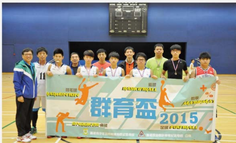
籃球隊隊員於賽後合照。