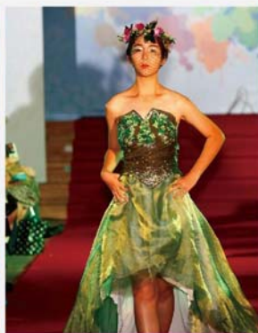
雖然當日擔任模特兒的同學並非專業，但表現都十分出色，令人眼前一亮。