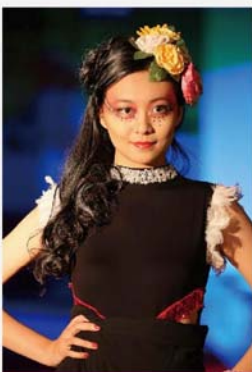
最佳模特兒：香港布廠商會朱石麟中學。