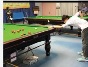
蔡同學專注地對待每一球，務求爭取佳績。