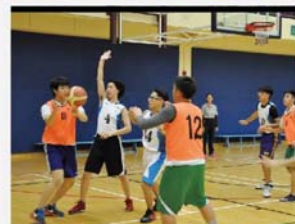
雙方攻防、戰況激烈！