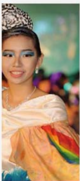
東色彩的服飾，一樣的禁毒信

是次我校很榮幸能邀請到香港特別行政區立法會主席曾鈺成議員及深水埗民政事務專員莫君虞先生為是次活動的主禮嘉賓，並邀得香港理工大學紡織及製衣學系吳文正教授、香港知專設計學院尹泰尉講師、著名模特兒楊崢小姐及著名時裝設計師馬偉明先生為是次比賽的評判，不僅令賽事順利進行，更令我校蓬華生輝。