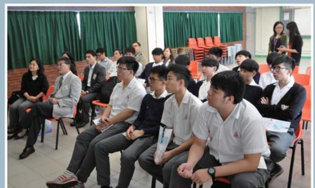
同學們正留心來賓的講解。