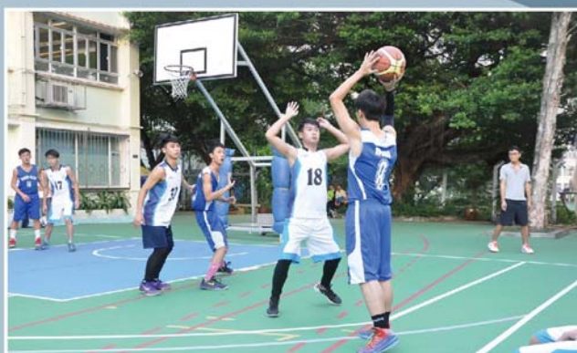
友校隊員攻守兼備，水準甚高。