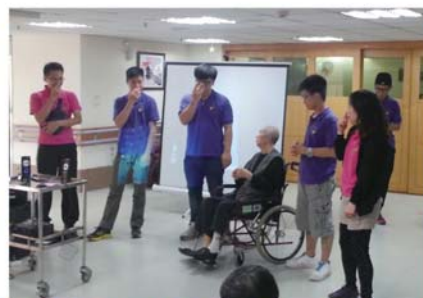
到台北的安老院探訪長者，與他們一起玩遊戲。