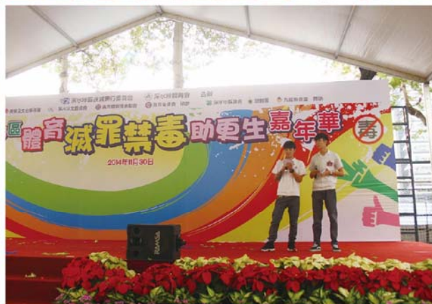
兩位司儀同學當日表現大方穩定，獲得不少來賓讚賞。