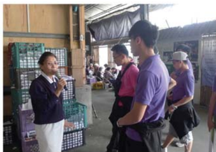
參觀環保回收中心，令同學大開眼界。