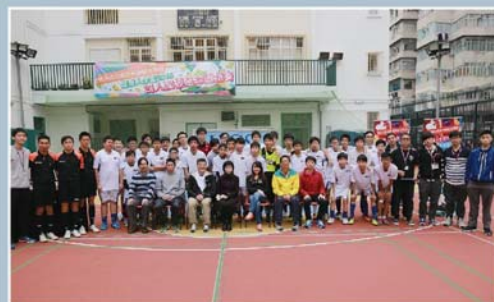
各得獎隊伍、來賓及工作人員大合照。