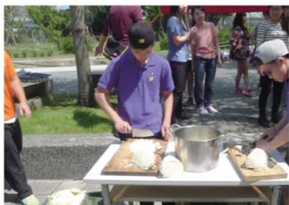
在烈日當空下製作餡料實在不容易。

扶少團全名為扶輪少年服務團，乃本校一個義工服務組織，學生們透過進行校內外的服務以貢獻社會之餘，亦可以讓學生拓展視野、增廣見聞及充實餘暇。在本年度的復活節，三位老師帶領著團員們去了台北進行服務交流活動。在第一天的服務行程中，同學們和台北扶青團團員一起製作餃子，派給當地的露宿者們。其後，同學們亦到了內湖慈濟回收站參觀，讓同學們明白到資源再用的重要，也學習到當地環保回收的文化及技術。之後我們到了台北市至善老人安養護理中心，同學們為長者們表演魔術，亦一起玩遊戲，最後我們亦送了一些小禮物給他們，一起過了一個愉快和有意義的下午。✎