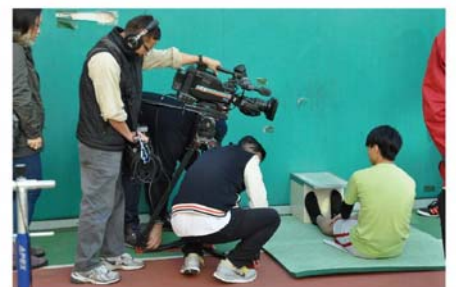
攝製隊正在拍攝同學進行體能測試。