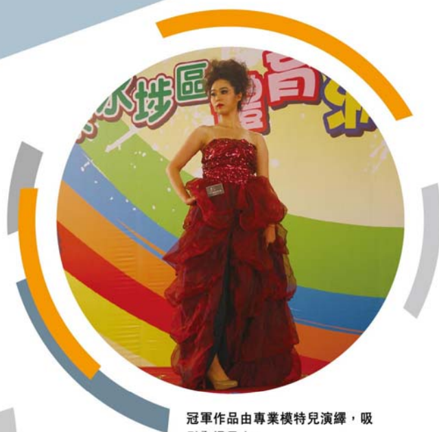
冠軍作品由專業模特兒演繹，吸引全場目光。