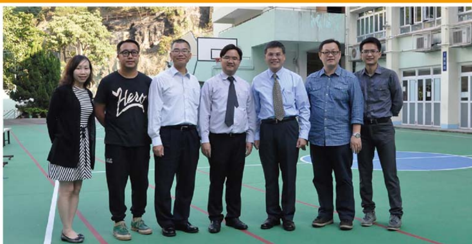
賽前兩校校長及社工老師們合照留念。