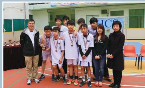
殿軍：佛教葉紀南紀念中學。