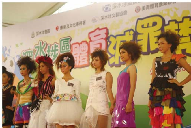
當日模特兒們的演出十分專業，傳遞禁毒訊息。