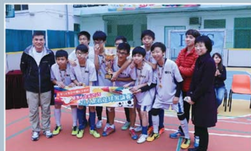
冠軍：香港四邑商工總會黃棣珊紀念中學。