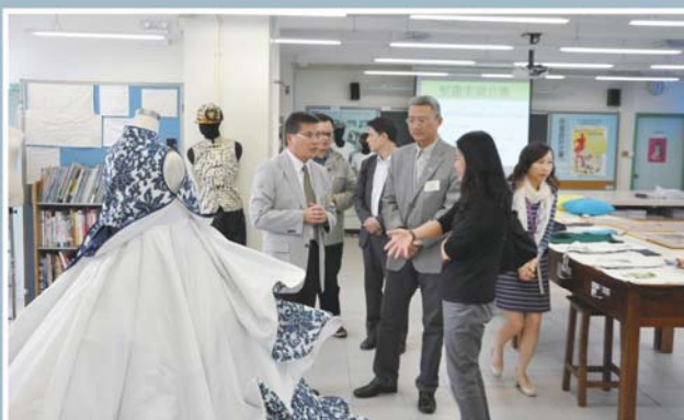
黃校長向潘院長介紹學生時裝設計科的作品。