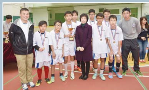
季軍：伊利沙伯中學舊生會中學。