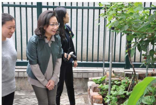
梁太正在觀察由有機肥料所栽種的植物。