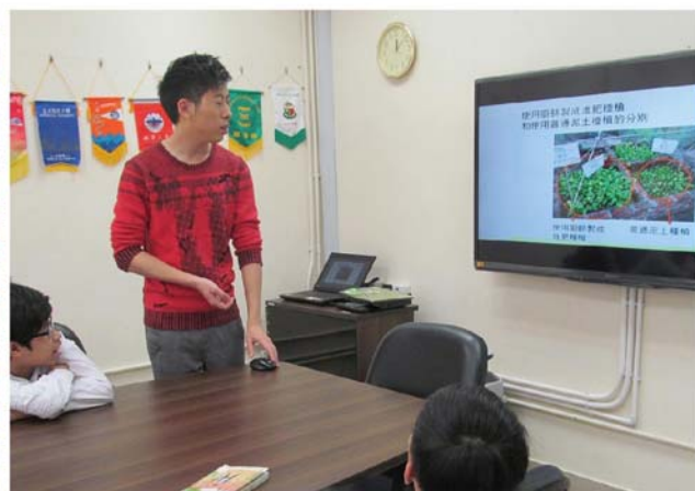
《校園齊惜福》計劃安排導師到校講解環保回收的重點和方法。