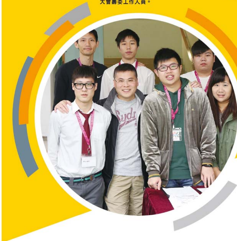
大會籌委工作人員。