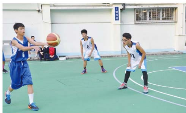
面對友校的進攻，我校隊員都不敢怠慢，聚精匯神地防守。