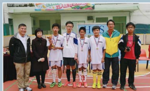
亞軍：保良局馬錦明中學。