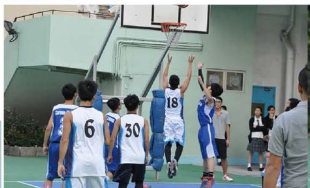
搶奪籃板球，雙方爭持不下。

為使學生有更健康的身心發展，我校一向提供不少多元的活動予學生參與，就以籃球隊為例，自去年由專業的教練帶領後，我校籃球隊的水準日益提升，曾勇奪群育盃冠軍，令隊員們士氣大振。為了使技術更上層樓及與各校隊員建立友誼，我校籃球隊積極與各友校切磋球技，交流心得。2014年11月25日，我校隊員到了基督教聖約教會堅樂中學進行友誼比賽，戰情相當激烈，雖然最後我校球隊不敵落敗，但隊員們於賽事中發揮出色，精神可嘉，更重要的是他們學到了「人外有人、天外有天」的道理，與及珍惜建立於球場上的友誼。✎