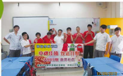
獅子會姊妹學校計劃：沙田公立學校送月餅服務