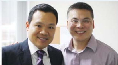
智易金融集團【工作體驗計劃】