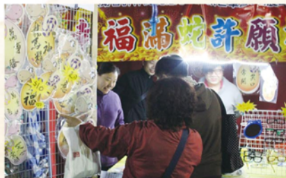
公益少年團年宵攤位活動