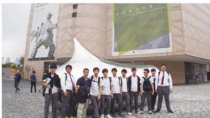
藝發課參觀藝術館