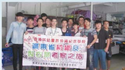
廣東省製衣業交流團