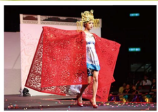
亞軍作品造型特出且高雅，吸引全場目光。