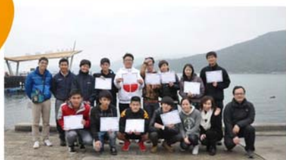
Outward bound 外展訓練