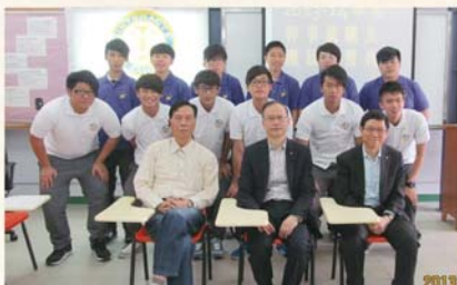
扶輪少年服務團幹事就職暨團員宣誓禮