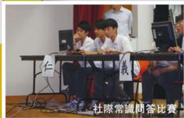
社際常識問答比賽