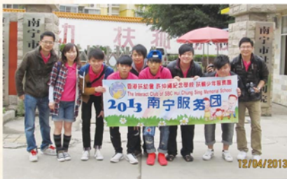
扶輪少年服務團南寧服務