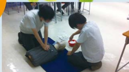
聖約翰救傷會急救入門+心肺復甦證書課程