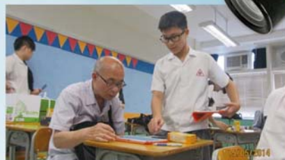
公益少年團長者電腦班