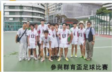
參與群育盃足球比賽