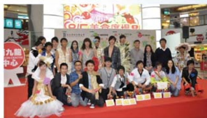
深水埗區議會環保時裝設計比賽