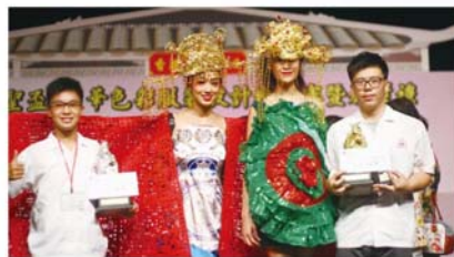
中華色彩服裝設計比賽