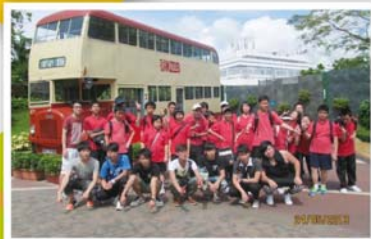
獅子會姊妹學校計劃： 參觀海洋公園