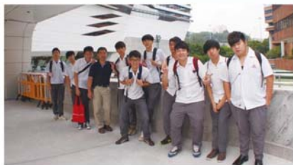
藝發課參觀理工大學設計展