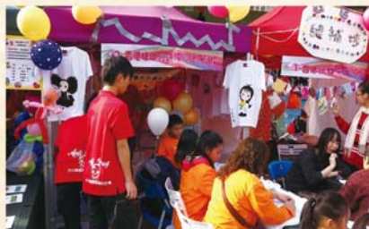
手繪T-shirt攤位義工服務