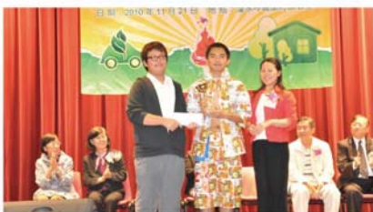
DIY環保時裝設計比賽