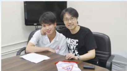
校園報 — 許校報