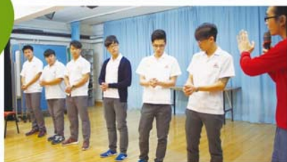
香港話劇團到校表演