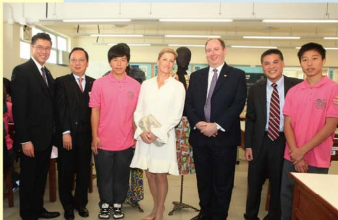
伯爵夫人及嘉賓們於製衣室與校長和學生合照。