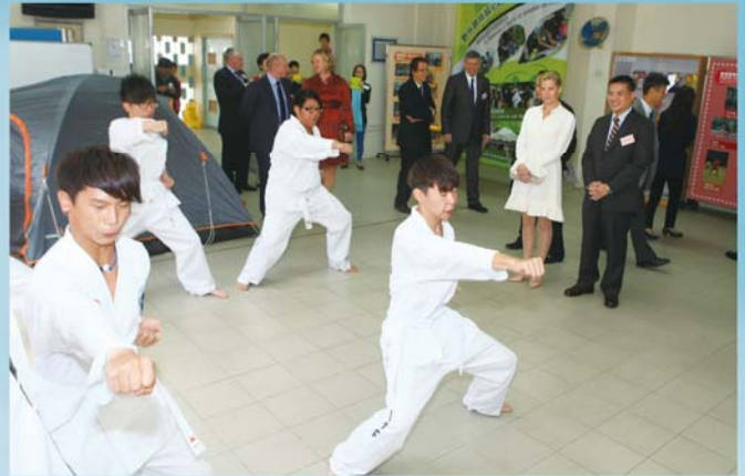
伯爵夫人欣賞「康樂體育科」的跆拳道表演。