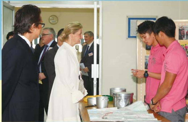
同學們向伯爵夫人講解「野外鍛鍊科」活動。