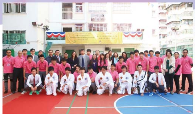
嘉賓、師生及家長大合照。