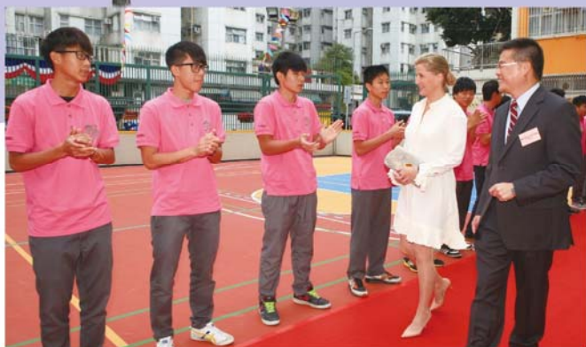
師生列隊歡迎伯爵夫人。