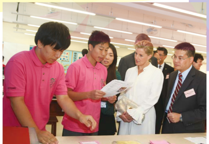
同學們向伯爵夫人講解製作漫畫T-shirt的步驟。