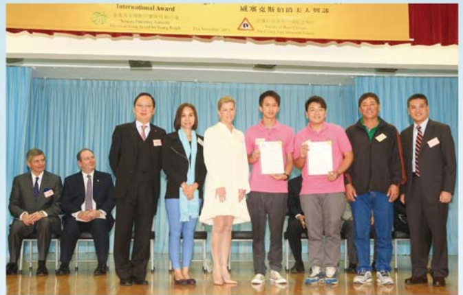
伯爵夫人及嘉賓們嘉許得獎同學。

本校能得到愛丁堡公爵國際獎勵計劃大使威塞克斯伯爵夫人的來訪，實在深感榮幸。由於本校是一所群育學校，收容情緒及行為問題學生，學生學術基礎普遍稍為低於水平，而香港青年獎勵計劃的目的正是協助青少年善用餘暇，發奮自勵，挑戰自己，服務社會，我們認為很適合我校學生參與，因此，學校自2009年加入 AYP，並投放大量資源及積極推動 AYP，透過各種體藝活動培養他們的興趣，挑戰自我及增強學生的成功感，而是次得獎的同學能得到威塞克斯伯爵夫人的嘉許和鼓勵，相信一定能激勵同學們更進一步，邁步向前。許