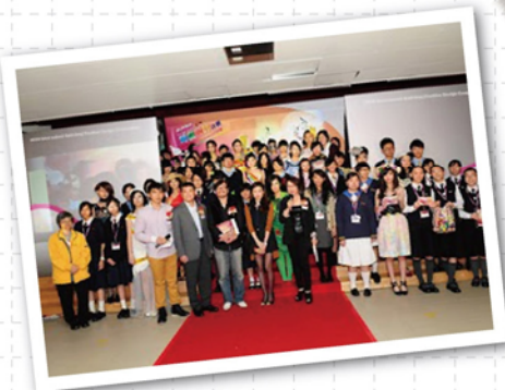
「2013禁毒時裝設計比賽」合照